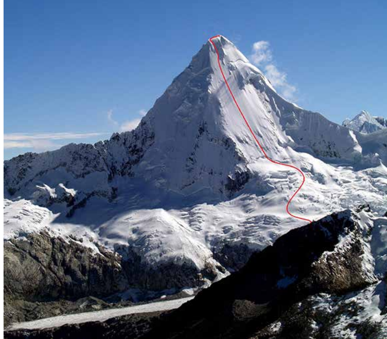
Artensoraju, 6025 m, Cordillera Blanca, Perù.

Evento realizzato con il sostegno di GLIP - The lighting partner